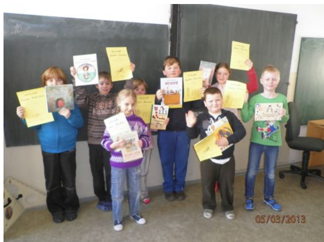
Žáci a jejich odměny za recitaci.

Kdo ví, třeba budeme připraveni, až nás podobný problém potká.