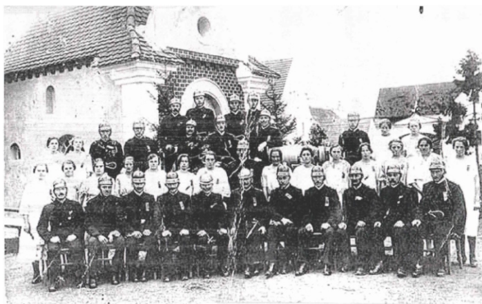
Hasičský sbor - 1926