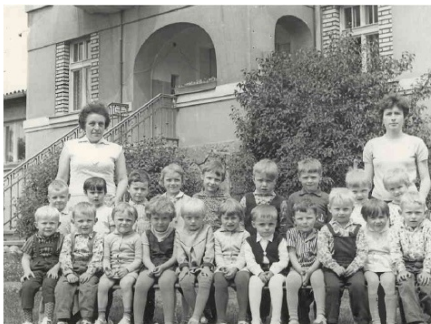
V Mateřské škole 1968