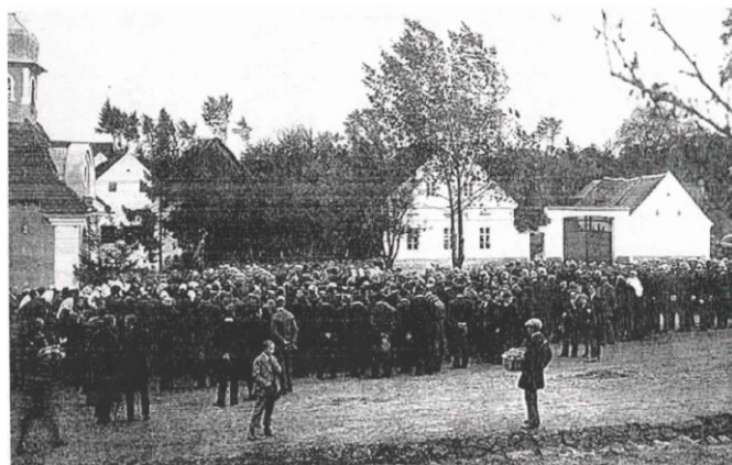
Svěcení hasičské stříkačky - 1926