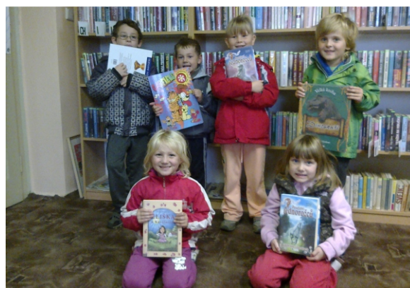
Děti z MŠ Hradec na návštěvě v knihovně