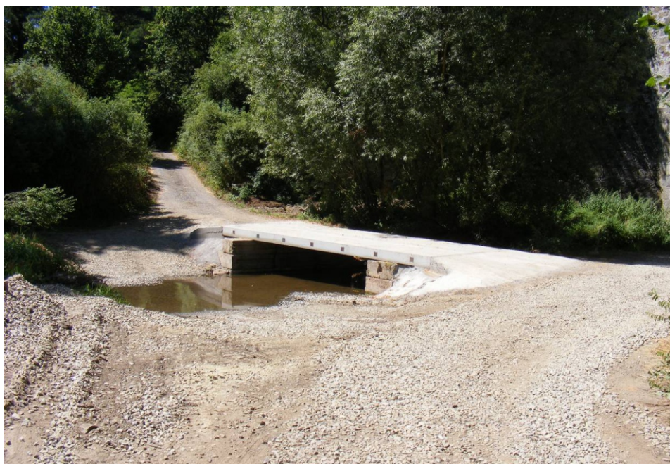
Opravený most k chatové osadě