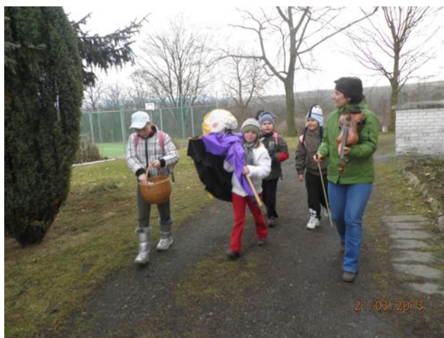
...my čekali jaro a zatím...