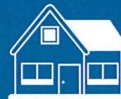
Online aplikace Katastru nemovitostí